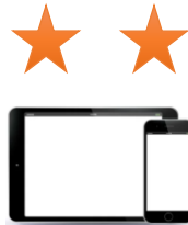
모바일 기기 (휴대폰, 태블릿 등)