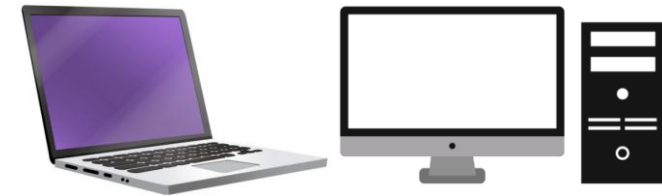
PC (노트북, 데스크탑 등)

* 「대학스포츠 업무포털」 시스템은 크롬(Chrome) , PC 기기에 최적화되어 있음