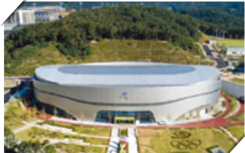
↳ 국가대표 진천선수촌 벨로드롬 1층