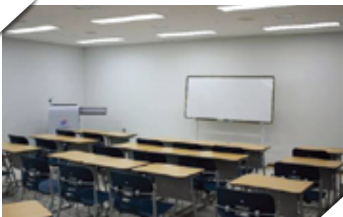
↳ 챔피언하우스 2층 강의실(2실)