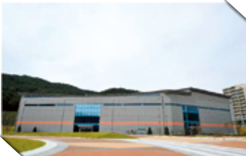
↳ 국가대표 진천선수촌 챔피언하우스 2층