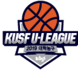
KUSF 대학농구 U-리그 (남/여)