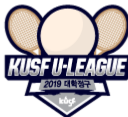
KUSF 대학정구 U-리그