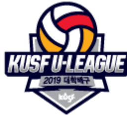
KUSF 대학배구 U-리그