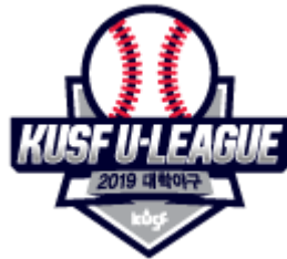
KUSF 대학야구 U-리그