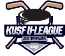
KUSF 대학아이스하키 U-리그