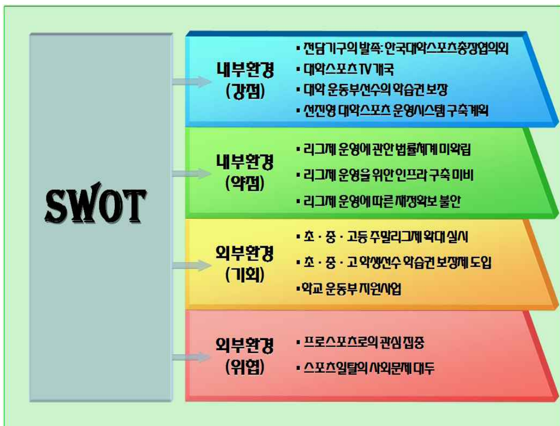
그림 7. 대학스포츠리그 환경분석